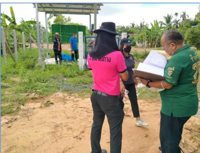
โครงการขุดเจาะบ่อบาดาลพร้อมติดตั้งพลังงานแสงอาทิตย์ บ้านหนองไทร หมู่ที่ 9