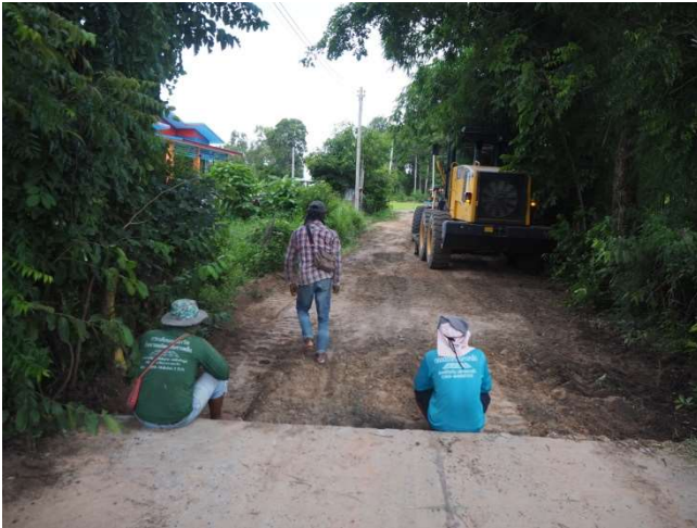
โครงการก่อสร้างถนนคอนกรีตเสริมเหล็ก บ้านตลาดชัย หมู่ที่ 8