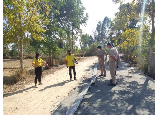
โครงการปรับปรุงถนนลงหินคลุกบ้านกิจสมบูรณ์ หมู่ที่ 6