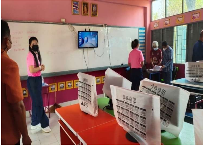
โครงการจัดหาคอมพิวเตอร์เพื่อการศึกษา