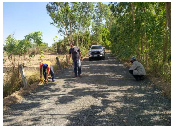
โครงการปรับปรุงถนนลงหินคลุกบ้านกระเต็ง หมู่ที่ 2