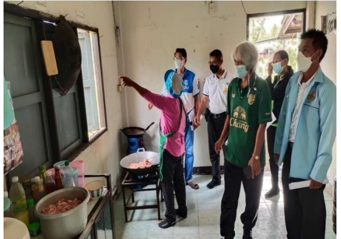
โครงการอาหารกลางวัน