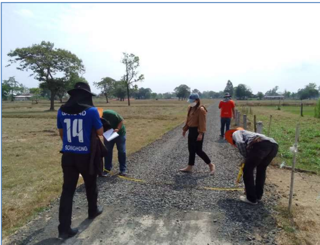
โครงการปรับปรุงถนนลงหินคลุกบ้านศรีทอง หมู่ที่ 10