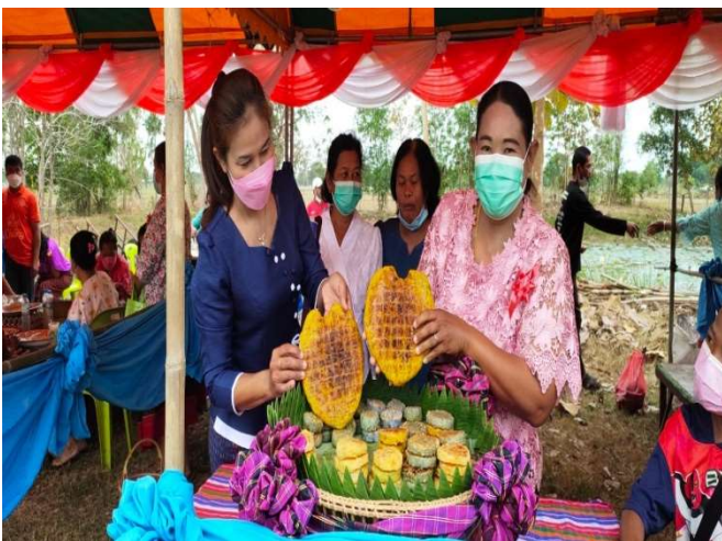
โครงการงานบุญประเพณีบุญข้าวจีประเพณีผูกเสี่ยว บ้านหนองสองห้อง หมู่ที่ 11