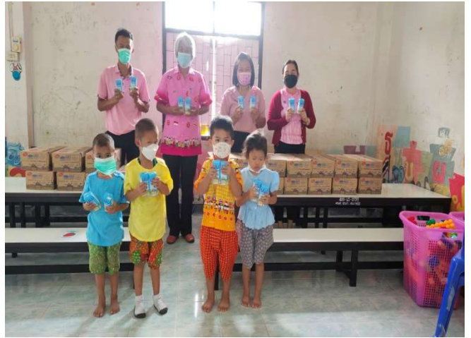
โครงการอาหารเสริมนม