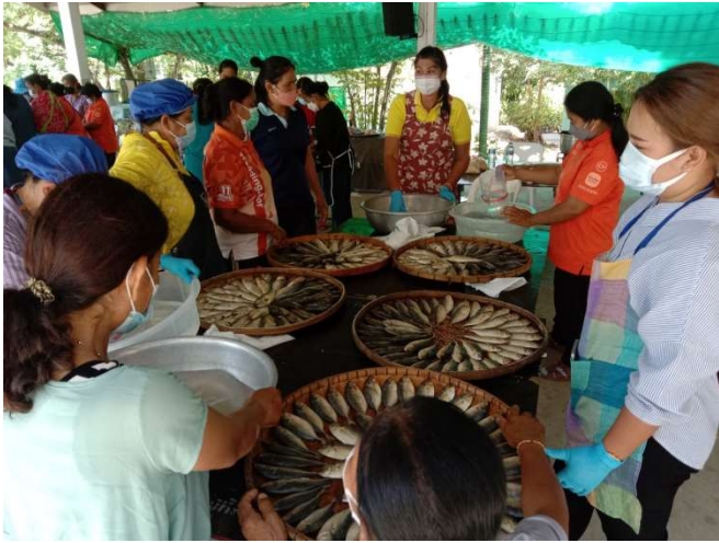
โครงการฝึกอบรมการแปรรูปปลา