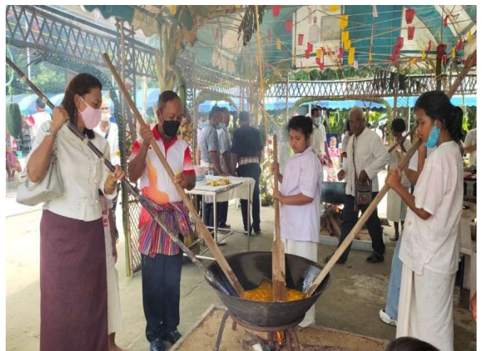
โครงการประเพณีกวนข้าวทิพย์ บ้านโคกใหญ่ หมู่ที่ 3