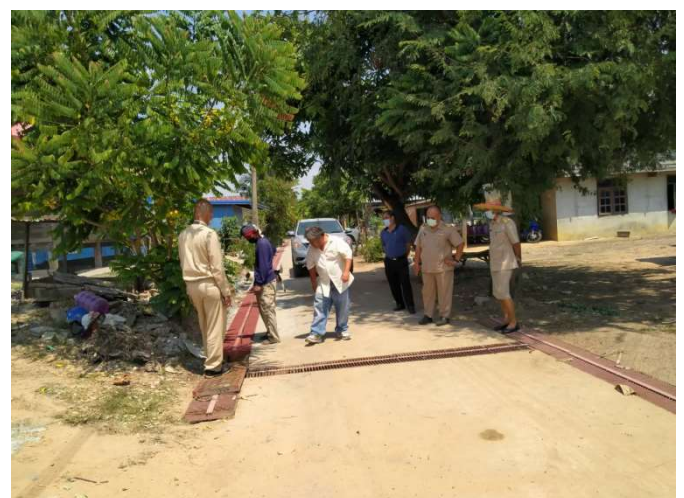
โครงการก่อสร้างรางระบายน้ำคอนกรีตพร้อมฝापิดรางน้ำ บ้านศรีเพชร หมู่ที่ 12